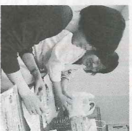
組合員と役員が顔を合わせる瞬間（愛知県東海支部）