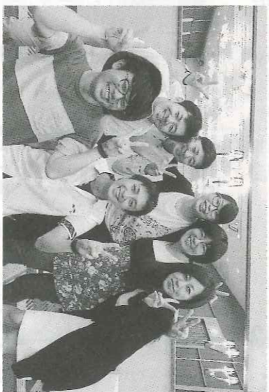
拡大の原動力となっている各組合の若手役員

く飛躍している。国共組東海支部は「一階に考えてくれ大切な仲間ができた」と語る。随時組合説明会では、失敗を増やし、現在は70人。最近ではLINEを使い、各職場の活動の様子を常達シリオの効果が拡大させざるを得ない要求も前進し