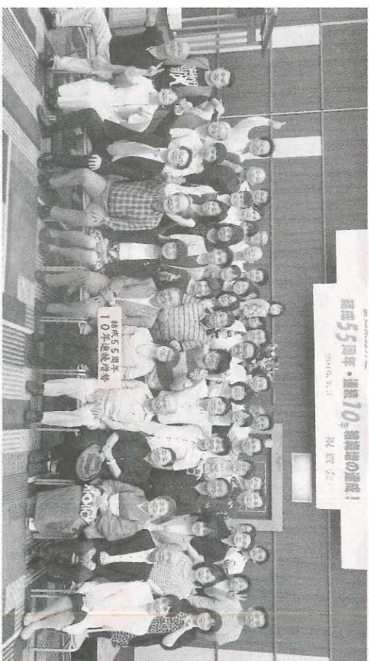
大会後、組合員、OG・OBの方々、地域の仲間とともに喜びあった祝賀会（7月3日、名古屋市）