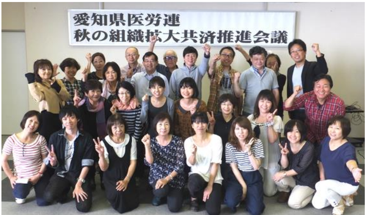
三ヶ根グリーンホテルで参加者のみなさん。