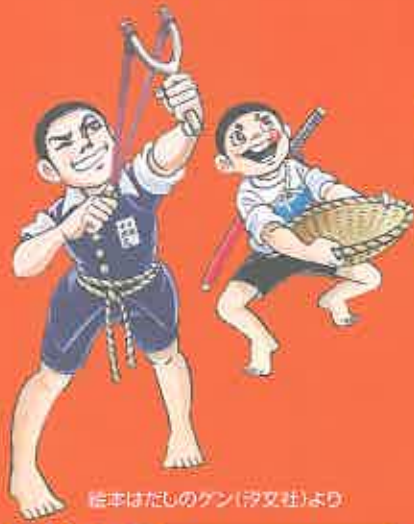
絵本はだしのゲン(汐文社)より