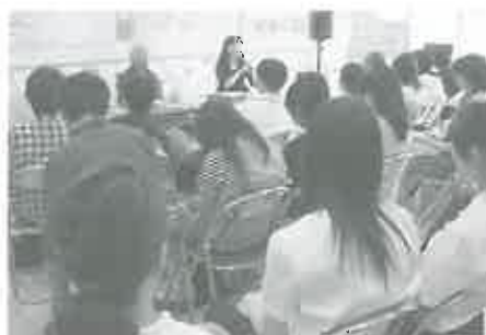
◎ 昨年のイベントの様子