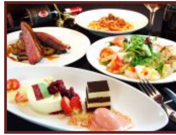
AC Milan Caffè e Ristorante